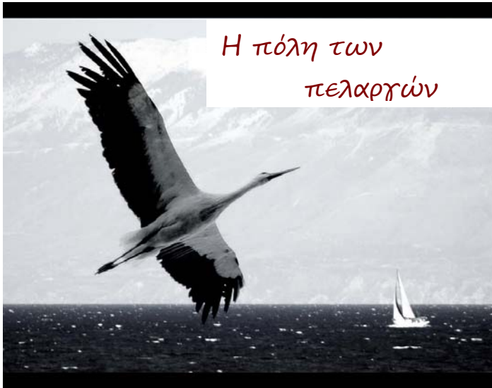
Η πόλη των πελαργιών

Η Φιλιππιάδα είναι μια μικρή πόλη, η δεύτερη του Νομού Πρέβεζας. Η θέση της είναι κομβικό σημείο των Νομών Πρέβεζας, Άρτας και Ιωαννίνων. Πήρε το όνομά της από την αγάπη των κατοίκων προς τα άλογα (ίππους). Η Φιλιππιάδα αποτελείται από τρεις συνοικισμούς: Παλαιά Φιλιππιάδα, Νέα Φιλιππιάδα και Ελευθεροχώρι. Στην αρχαιότητα υπήρχε με την ονομασία Χάραδρον. Σήμερα είναι η έδρα του Δήμου Ζηρού, ο Δήμος που ανήκει και το χωριό μας.