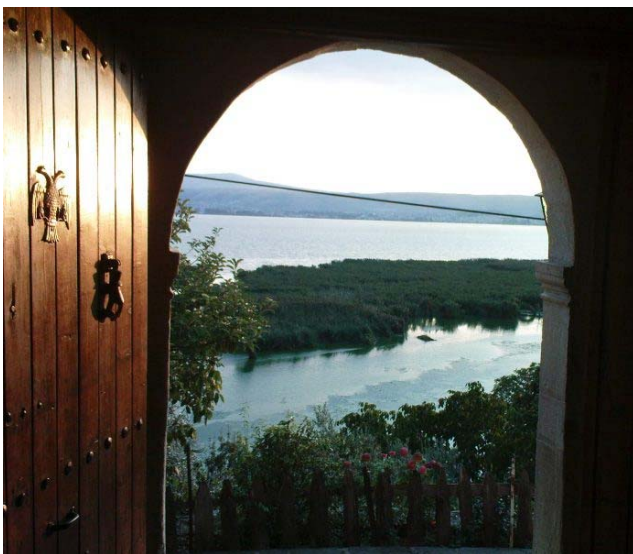
Φωτογραφίες από την εκδρομή της Αγ. Τριάδος "Φανερωμένης" Παπαδατών στη Μονή, την Τετάρτη 25/05/2011